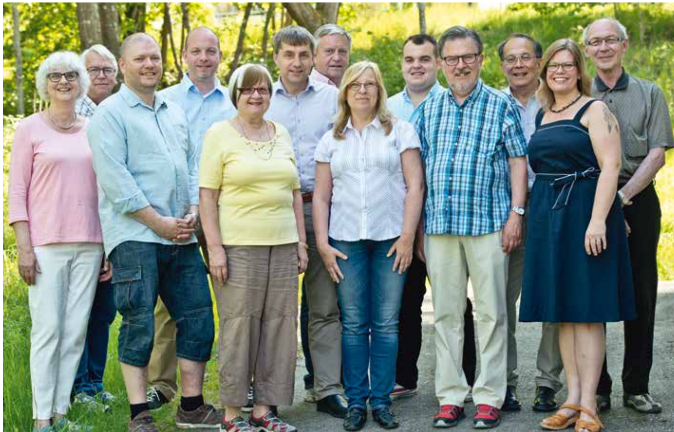
Socialdemokratiska kommunfullmäktigekandidater i Salem i valet 2014.

Ansvarig utgivare: Tommy Eklund, Socialdemokraterna i Salem. Redaktör: Gunila Kallio Nr 3, 2014