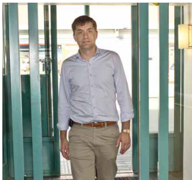
På väg in i kommunalhuset

Salem är helt beroende av en fungerande kollektivtrafik. Vi är många som jobbpendlar både till Stockholm och till